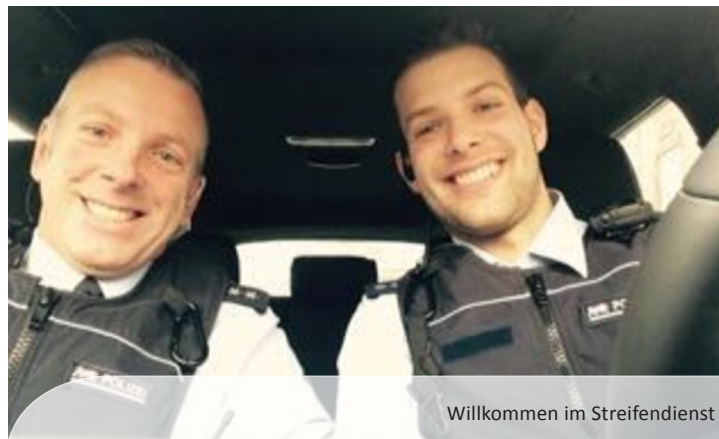
Willkommen im Streifendienst

Gewerkschaft der Polizei / Bezirksgruppe PP Mannheim Presse- und Geschäftsstelle * Hochuferstraße 54-56 * 68169 Mannheim Telefon 0621-1743403 E-Mail: info@gdpmannheim.de